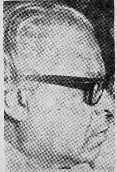
NICOLAS GUILLEN: la poesía como testimonio, histórico.

yes de la poesía y del devenir histórico de su patria, ensaya en su Diario que a diario las posibilidades de una obra abierta que recurre a diversas estructuras, a la paráfrasis, al collage, al aviso comercial, a las notas de vida social. En tal sentido, obviamente, el poeta aparece como un vasto conocedor de la Cuba de anteayer, de ayer, de hoy, y el libro queda abierto. Aspectos de costumbres, valores, modos de vivir a través del tiempo histórico de las dependencias, se encarnan