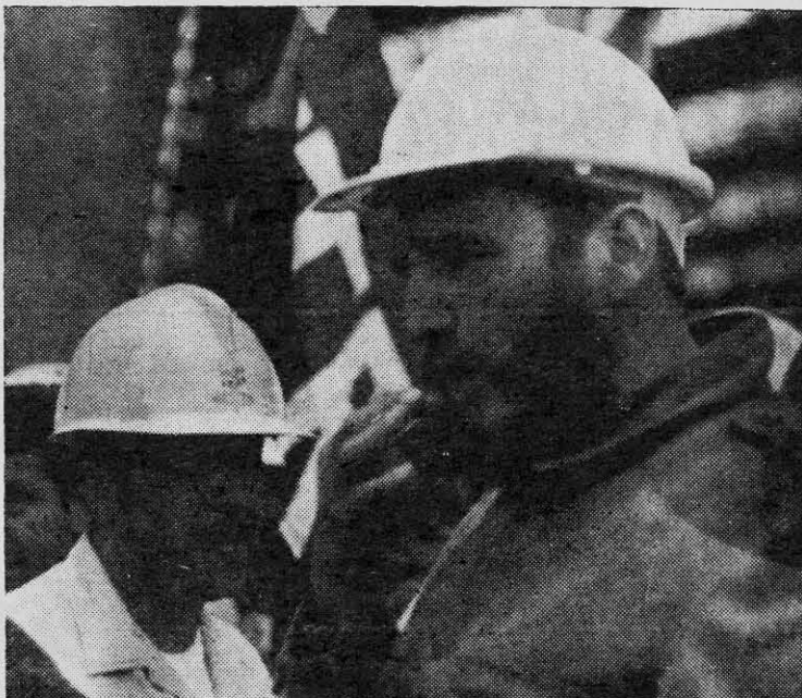
FIDEL CASTRO: protagonista de la historia contemporánea de Cuba.

Cualquiera podría pensar, a la luz de estos textos fragmentarios que sin embargo tienen un hilo subterráneo común, como sucede con la historia, que el poeta ha efectuado aquí un experimento de laboratorio donde apenas interviene la transformación que debe proyectar todo poeta sobre la materia que recoge, y por la vía del lenguaje. Estaríamos, luego, en presencia de una labor de recorte de modelos para armar: pero nada de esto sucede en el libro. Intencionalmente, Nicolás Guillén retrocede siglos y se sitúa en los períodos cronológicos en los cuales se desarrollan tanto la factoría como el coloniaje de su Isla madre. Guillén adopta las formas de expresión más castizas, por ejemplo, en la partida, y de ese modo va mostrando la dependencia de su país respecto de España. Después vienen pequeños poemas en cursiva (a todos ellos, el poeta les pone el nombre de paréntesis ) y de inmediato se advierte, poco a poco, un cambio en la estructura misma y en los contenidos del o los lenguajes: la castellanía se reemplaza por el afrancesamiento; hay, también, levisimas alusiones al poder inglés, y ello se desprende del breve período del mando británico que hubo sobre Cuba. Más adelante, ya hacia el fin del libro, puede apreciarse el paso gradual rumbo a ciertos gestos independentistas que son ahogados en sangre: la lucha definitiva en contra del domi-