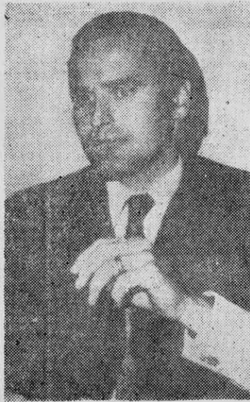
ROBERTO THIEME: el fantasma de la guerra civil.

E L cuadro político ha tomado en el último período el signo inequívoco de una agudización de la lucha de clases. Aunque ella se mantiene dentro de cauces relativamente pacíficos, ya no caben dudas de que la burguesía está redoblando sus esfuerzos para provocar una crisis que se resuelva en el enfrentamiento. Su tarea es visible en distintos campos. Desde la "oposición desde la base" que trata de implementar la Democracia Cristiana, hasta los trajines puramente conspirativos que se han venido detectando. Entre estos el más resonante —aunque quizás no el más importante— ha sido la aparición en Argentina de Roberto Thieme, dirigente del grupo fascista "Patria y Libertad", que presuntamente había perecido en un accidente aéreo en el mes de febrero. La "resurrección" de Thieme en Mendoza se produjo en circunstancias reveladoras. Los conspiradores como Thieme disponen de grandes recursos económicos cuyo origen no es di-