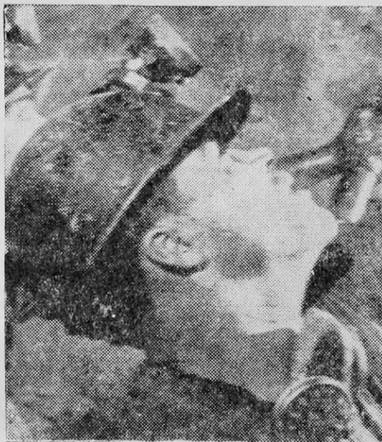
LOS AGENTES de la burguesía y del imperialismo tratan de usar a los mineros del cobre contra el proceso en marcha en el país.

El trabajador del cobre es un hombre como cualquier otro. Pero tiene sus particularidades. En el fondo del oscuro y frío pique de El Teniente o bajo el implacable sol del desierto en Chuquicamata, a