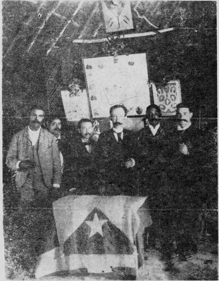
JOSE MARTI, el Apóstol de la independencia cubana, aparece en esta foto en una reunión celebrada el 10 de octubre de 1892 en Temple Hall, Jamaica.

En la campaña de Pinar del Río, tomó parte Vargas Sotomayor, en la mayoría de las centenares de acciones de guerra libradas por las fuerzas libertadoras, al mando de Maceo, y, especialmente en la famosa batalla de Ceja del Negro —4 de octubre de 1896. Había sido ascendido el 26 de febrero de ese año como premio a sus inestimables servicios a la causa cubana, a general de brigada. Pero, las heridas y las enfermedades habían minado su cuerpo de acero, y en El Rubí, provincia de Pinar del Río, murió a fines de octubre de 1896, el general y héroe del Ejército Libertador de Cuba,