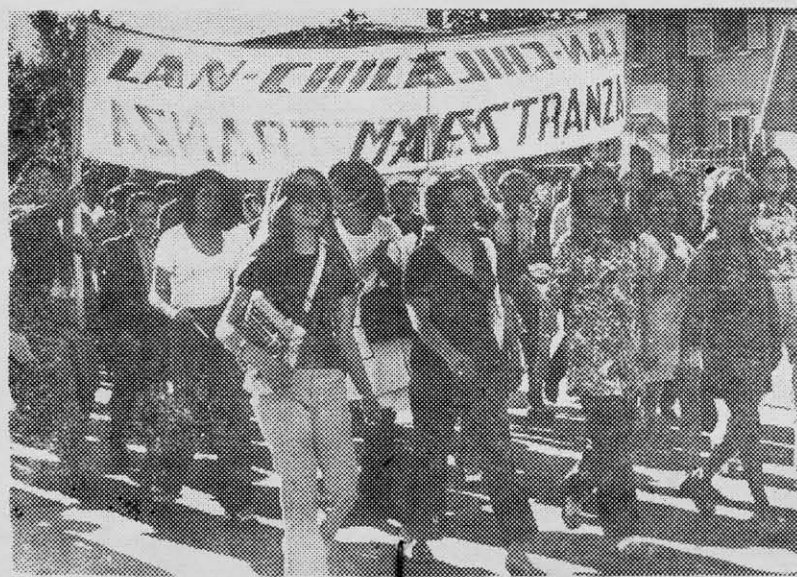
EL GOBIERNO apoyado por las masas dio un paso adelante hacia el área social.

Ese proyecto estableció la garantía de no expropiación a las empresas cuyo capital fuera menor a los 14 millones de escudos