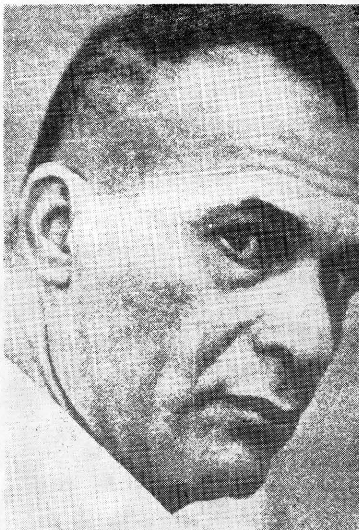
CARLOS MARIGHELLA, el gran revolucionario brasileño cuyos escritos han sido publicados en Chile por Prensa Latinoamericana.

Muchos revolucionarios valiosos como Marighella, y recientemente Carlos Lamarca, han caído combatiendo en Brasil. La lucha es particu-