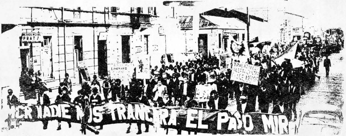
LA CORTE DE APELACIONES de Temuco ordenó la libertad incondicional de los terratenientes que asesinaron a Moisés Huentelaf. En cambio, ordenó procesar a los campesinos. Es lo que se llama "justicia de clase".

sar, siempre que fueran y regresaran acompañados por los carabineros. Momentos más tarde, sin embargo, éstos últimos volvieron solos. Doyharzábal y los otros 2 momios se habían atrincherado en el interior de las casas y desde allí reanudaron el fuego contra los campesinos, a vista y paciencia de la fuerza policial.