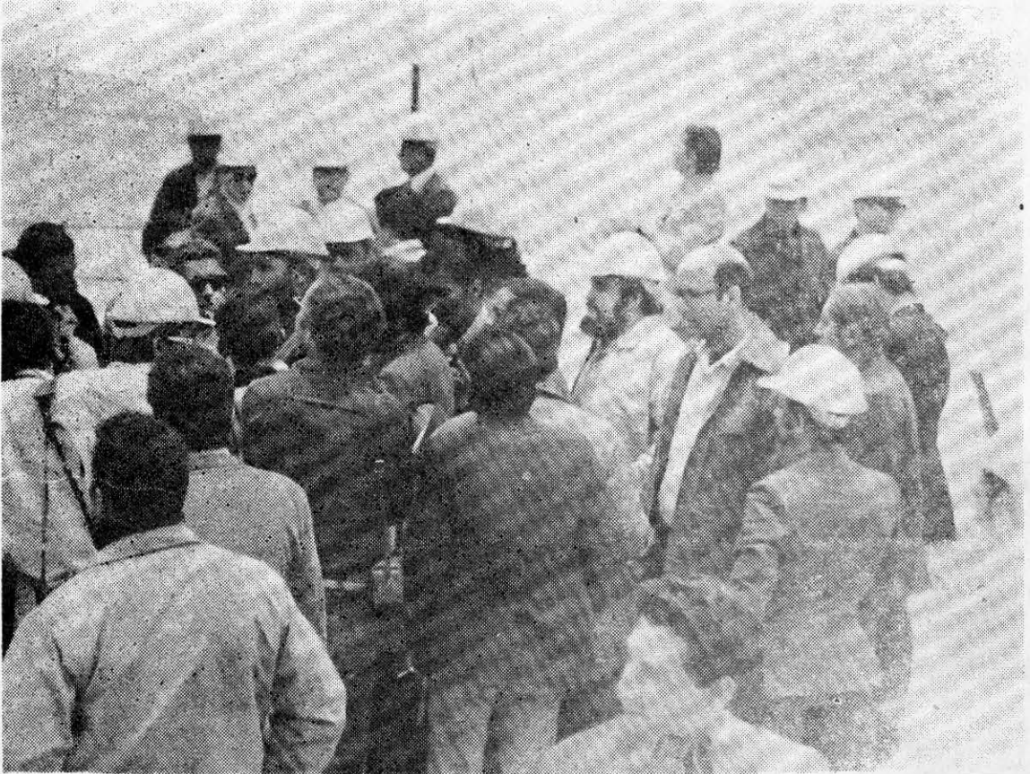
Le tocó la hora a los periodistas. Son ellos los que aquí en Pedro de Valdivia, hacen preguntas a Fidel. Hubo diálogo continuo entre obreros, periodistas y Fidel Castro.

a la escuela, a las mejores escuelas, a las mejores enseñanzas. Si el padre era rico, tenía derecho a ir a una secundaria; si el padre era rico tenía derecho a una Universidad. Todas esas posibilidades tenía. Si el padre era rico tenía derecho a tener un automóvil. Si el padre era rico tenía derecho a viajar al exterior. Si el padre era rico tenía derecho a irse a los mejores lugares de recreación. Y los que no lo eran, que eran la inmensa mayoría, no podían ir muchas veces a una escuela, o no tenían zapatos para ir a una escuela, y no tenían un hospital óptimo donde ir, porque el hijo del rico iba al mejor hospital, el hijo del rico iba al mejor médico, el hijo del rico recibía las mejores medicinas, y si tenían que llevarlo al extranjero, al hijo del rico para salvarle la vida, lo llevaban al extranjero. Pero el hijo del pobre no tenía esas posibilidades. ¡Qué maravillosa libertad burguesa! En nuestra patria libre hoy, no hay un niño que no tenga zapatos, no hay un niño que no tenga oportunidad de ir a la escuela, que no tenga oportunidad de recibir la mejor educación con los mejores libros de texto, con los mejores maestros, que no tenga oportunidad de ir a una secundaria. No hay un solo niño que no tenga oportunidad de ir a una Universidad, no hay un solo niño que no tenga oportunidad de ir a estudiar al extranjero, incluso, si es un talento que