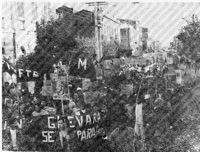
El FTR (Frente de Trabajadores Revolucionarios) realizará a fines de mes un Encuentro Nacional, en vísperas del Congreso Ordinario de la CUT, máximo organismo de la clase trabajadora chilena.