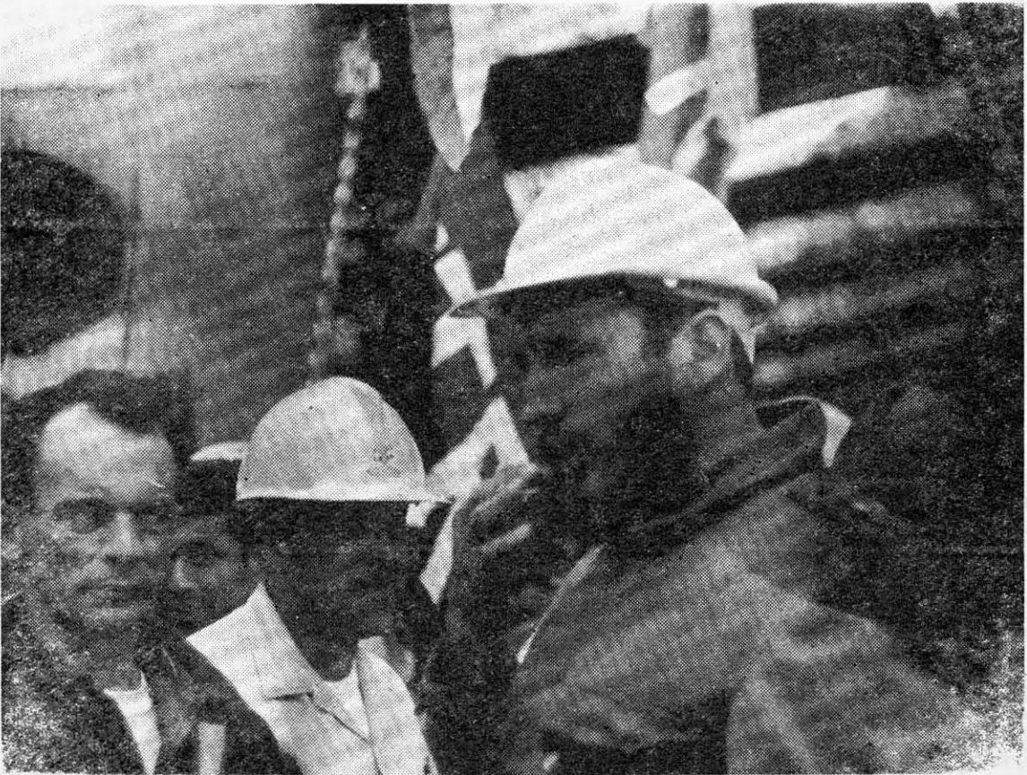
Fidel Castro en Chuquicamata; calcula porcentajes antes de iniciar otra andanada de preguntas. Es extraordinario el interés que el Primer Ministro cubano ha manifestado por todo lo relacionado con la producción de cobre.

Pero creemos que una rápida fundamentación de estos pensamientos era imprescindible. Estamos conscientes que teniendo clara la razón ideológica de la unidad entre revolucionarios, lo importante es verificarla en los hechos. Repetimos que PF —y sabemos que no es mucho— está dispuesto a dar su contribución en ese sentido. No podemos admitir, como ningún sector que honestamente luche por la liberación definitiva de Chile, que se pierda esta oportunidad histórica de atacar y vencer al verdadero enemigo.