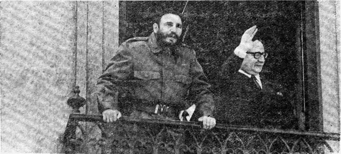
SALVADOR ALLENDE, Presidente de Chile, y Fidel Castro, Primer Ministro del Gobierno Revolucionario de Cuba, saludan a la multitud desde un balcón del palacio de gobierno en Santiago.

L A visita de Fidel Castro a Chile ha sido un gran acontecimiento revolucionario. Después de largos años de segregación diplomática y comercial, impuesta por el imperialismo norteamericano, la Revolución Cubana se ha reencontrado con América latina, a través de las manifestaciones de masas que han rodeado la visita de Fidel a Chile. La existencia en nuestro país de un Gobierno Popular, como el que preside Salvador Allende, ha hecho esto posible. Durante más de 10 años, la Revolución Cubana ha sido víctima de toda clase de agresiones y el imperialismo ha tendido en torno suyo una espesa cortina de mentiras, calumnias y viles falsificaciones de su realidad. Pero, no obstante, la visita de Fidel a Chile ha demostrado cuán vigorosa es la imagen que la Revolución Cubana proyecta en las masas de trabajadores y jóvenes del continente. Estamos seguros que si Fidel pudiera,