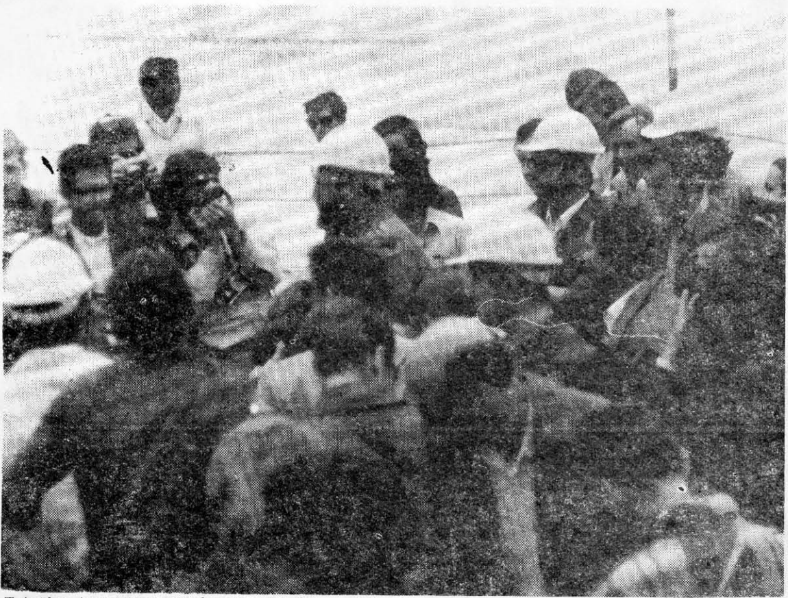
Este fue turno para fotógrafos. El Primer Ministro estuvo siempre de buen humor y muy afectuoso. Posa para las "leicas" en Pedro de Valdivia.

ben luchar, dar un tratamiento correcto a los técnicos. Consejo de un comunista extremista, ¿comprenden? Ganen para la causa de la clase obrera a esos técnicos y si hay algunos que de ninguna forma pueden ser ganados, que nunca se diga que a esos técnicos los perdió la clase obrera y la nación chilena, porque se les trató mal, porque se desconfió, porque no se hizo un esfuerzo. Se los digo, por nuestra propia experiencia. Y se los digo, porque el país necesita esas inteligencias. No se olviden; llegará el día en que todos los niños sepan leer y escribir y tengan primaria, secundaria y técnicos. Llegará el día que a ustedes les sobren los técnicos. Pero hoy, en esas fábricas, complejas y difíciles, los técnicos juegan un papel importante. Yo les digo que hay técnicos ahí, hombres de calidad humana. Gánenselos para la causa del proletariado. Gánenselos para la causa del país. No dejen que esa batalla se las gane la reacción. Ese es el consejo que les da un comunista extremista. Le doy este consejo a la vanguardia, a los trabajadores voluntarios, a los que hoy estaban en esas minas, a ustedes, los que están reunidos aquí. Ustedes son el ejemplo, y saben con qué hay que predicar: con el ejemplo. Ustedes van ahí el domingo, en la mañana, a levantar escoria y a recuperar para la patria y para la clase obrera, desinteresadamente, la riqueza del