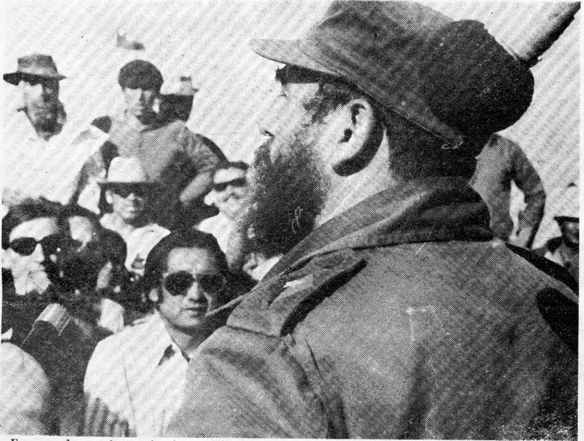
En una de sus improvisaciones, Fidel Castro se dirige a los obreros del cobre en el mineral de Chuquicamata.

prevaleció la unión ¿y quieren saber por qué la revolución cubana logró sobrevivir?: porque uno de los factores esenciales de la supervivencia fue la unión de todas las fuerzas revolucionarias. En eso creo ciegamente, como creo ciegamente que en la división está la derrota. Sobre eso no tengo la menor duda.