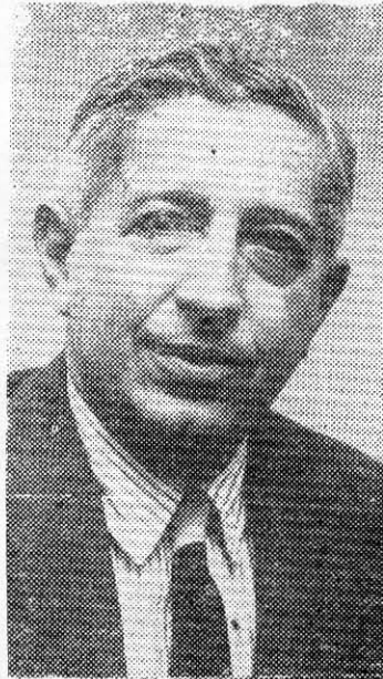
JOSEPH J. JOVA: acompañó a Frei en su gira por Estados Unidos.

Efectivamente, Joseph J. Jova jugó la influencia política norteamericana para que liberales y conservadores apoyaran incondicionalmente a