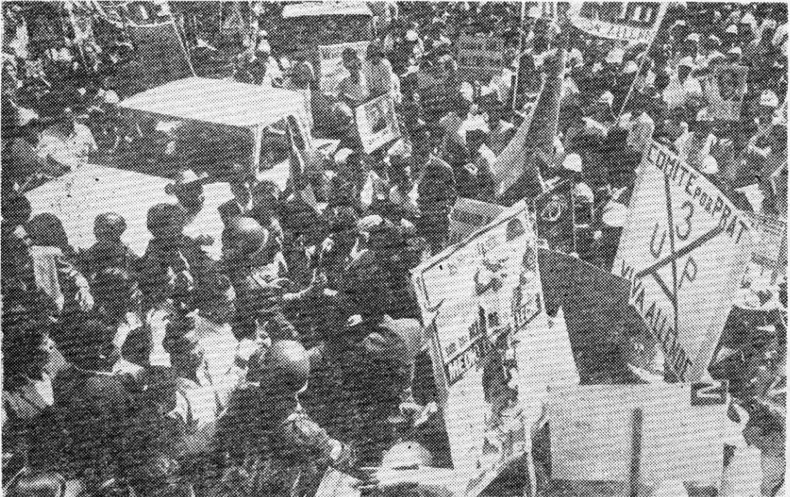
LOS OBREROS y campesinos dieron la victoria a la Unidad Popular en septiembre de 1970. Por ello es que la clase trabajadora de nuestro país es la más interesada en hacer irreversible el tránsito al socialismo.

La participación permite a los trabajadores adquirir mayor confianza en su poder de organización, ir fortaleciendo sus posiciones, ir formando cuadros dirigentes a través de la práctica diaria de este control y agudizando las condiciones entre los trabajadores y el Estado burgués. El objetivo fundamental de la participación debe ser poner la actividad económica del país, el Estado y los organismos de gobierno, bajo el control democrático y revolucionario de obreros y campesinos.