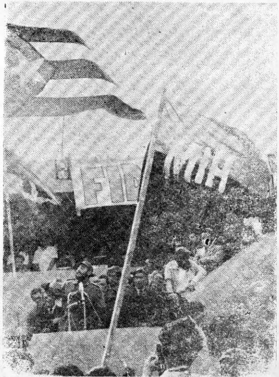
En Antofagasta: Fidel en uno de sus discursos.

Partamos por reconocer que las manifestaciones de sectarismo se producen en todos los niveles de la izquierda chilena. En algunas ocasiones es el equivocado método de sectores que así pretenden afincar su hegemonía política. En otras, es la errónea respuesta de sectores que se ven atacados o marginados por sus legítimas discrepancias con