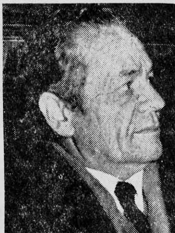
NICANOR PARRA: tomo té con la señora Nixon.

Al parecer estos esponsales fueron confirmados con su reciente visita a la Casa Blanca, invitado a un té ofrecido por la "primera dama" de los Estados Unidos, la señora Nixon. El matutino gubernamental "La Nación" publicaba en su edición del 5 de mayo (página 7) una foto tomada en la Casa Blanca con su correspondiente epigrafe, en la que se ve a la "primera dama" entregando un obsequio al sonriente Nicanor Parra, amparados por la mirada vigilante de un edecán militar del recinto presidencial norteamericano.