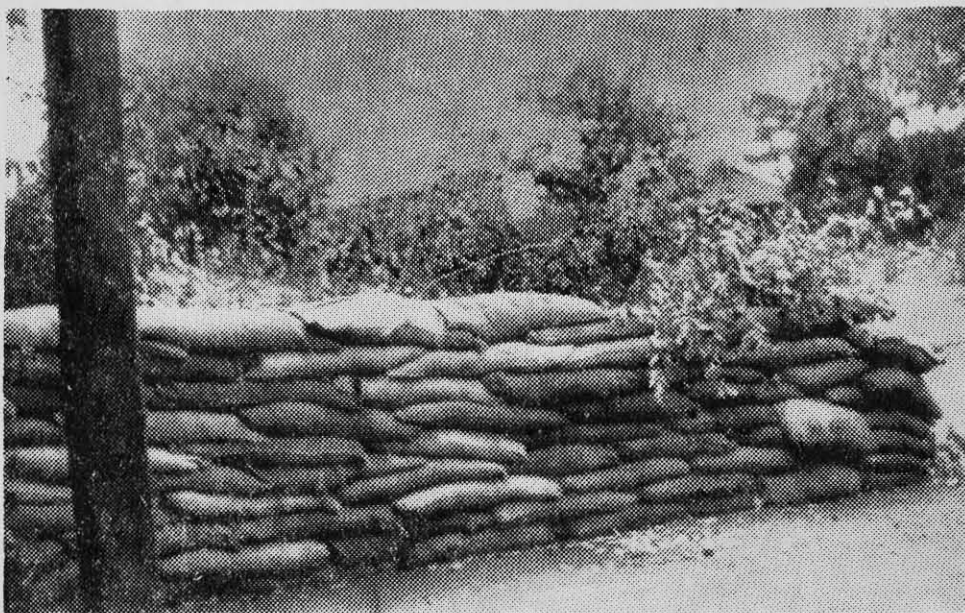
BARRICADAS con sacos de arena en la puerta del fundo "La Ermita", en Bulnes, provincia de Ñuble. Aquí presuntamente se han entrenado "guardias blancas" derechistas.