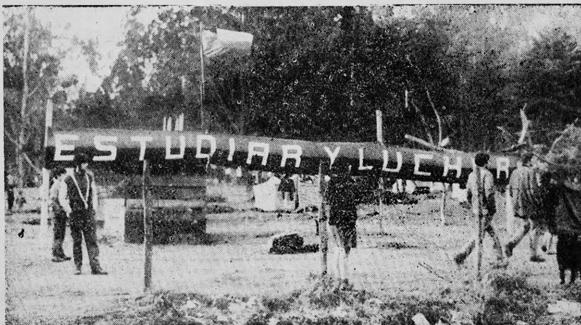
"ESTUDIAR Y LUCHAR" es el lema de la Federación de Estudiantes de Concepción, instalado en el centro del Campamento "Lenin" de Talcahuano.

ridad creará las más variadas maneras de enfrentamiento. Tendrá por esto que fijar, para cada caso, las más convenientes formas de acción común, conjugando los métodos legales e ilegales de lucha.