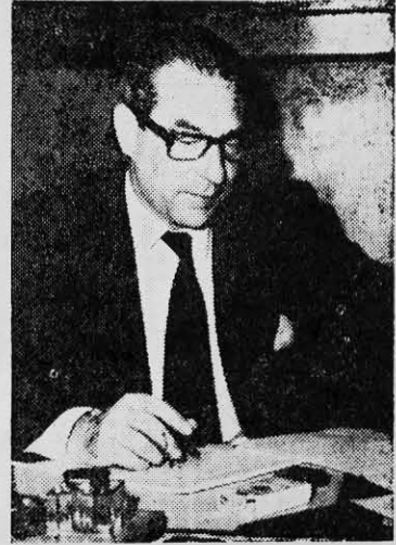
CANCILLER VALDES: financiamos el desarrollo de Estados Unidos.

Es evidente que el imperialismo norteamericano no patrocinará medidas que disminuyan sus ganancias en el continente y por eso no teme a nuevas políticas económicas "desarrollistas", que no significan otra cosa que "el