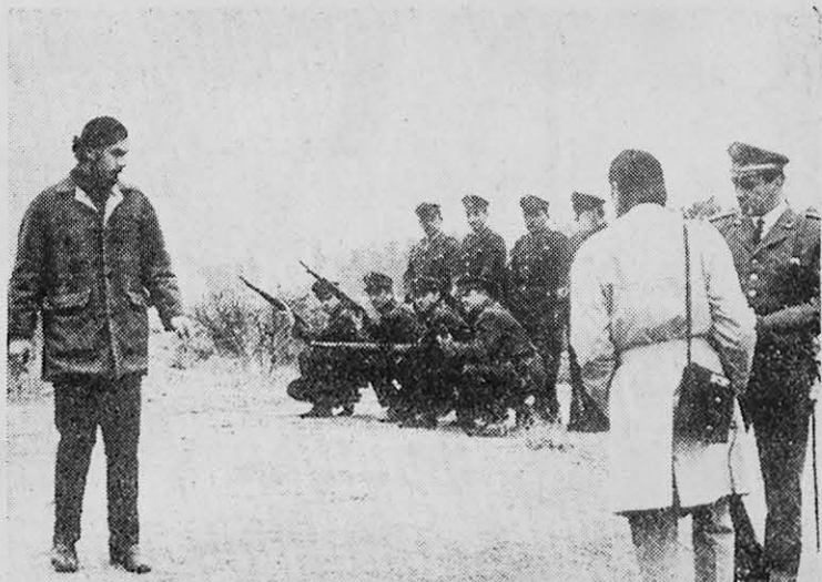
MIGUEL LITTIN (a la izquierda) dirigiendo "El Chacal de Nahueltoro". A la derecha, la represión.

La madre del Chacal que llora ante la sentencia es la misma que lo abandonó en la infancia. El profesor que le enseña las letras es el mismo que introduce en su mente la versión oficial —oligárquica— de la historia patria. La viuda que lo recoge cálidamente en su ruca dándole su cuerpo, su compañía y cinco huérfanos, es la misma que se emborracha y lo humilla soezmente. El juez —quizá el personaje más esquemático— que lo interroga paternalmente en la reconstrucción del crimen, es el mismo que en su club pituco lo define como a un ser inferior. El pobrero chileno que rodea densamente al Chacal a lo largo de su destino aparece hierático, como muerto, no ríe siquiera ante el vino, es el mismo que trabaja esclaviza-