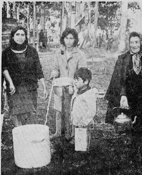
MUJERES E HIJOS de obreros están felices con la toma de terrenos del fundo "San Miguel" de Talcahuano, donde se creó el Campamento "Lenin".

2.— El Comité de Solidaridad Gremial (C.S.G.), tenderá a organizar en sindicatos a los trabajadores, manuales e intelectuales, del campo y de la ciudad, públicos y priva-