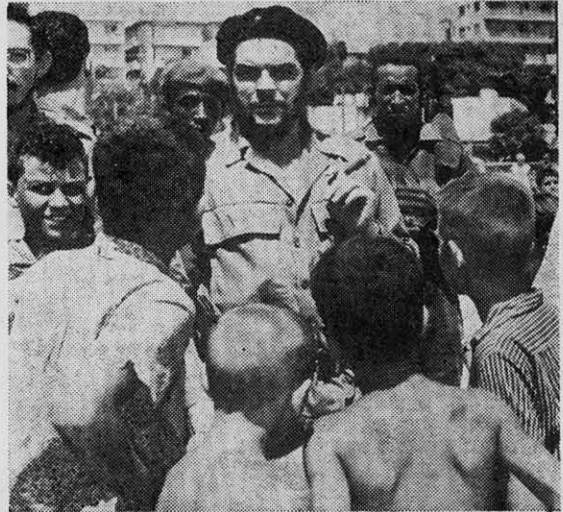
CHE GUEVARA, una expresión idónea de la Revolución Cubana, marcó el ejemplo de consecuencia revolucionaria.

Desatar las energías revolucionarias del pueblo, ése es el cometido de los partidos revolucionarios de vanguardia. Y cuando éstos no existen o son remisos, entonces surgen de algún modo los sustitutos. Los protagonistas del 26 de julio fueron, a falta de otra, la vanguardia revolucionaria del pueblo cubano. Y lo mismo está ocurriendo y puede suceder en todos los demás países americanos. Y ciertamente que es muy deshonroso, por no decir indecoroso, que los partidos revolucionarios tengan que acoplarse a la acción revolucionaria que otros han iniciado. Y peor aún es que esos partidos revolucionarios en teoría, abandonen, condenen y hasta traicionen a los que se deciden a hacer la revolución. Y se da aun el caso paradójico de que partidos que se dicen vanguardias revolucionarias están dispuestos a unirse para la lucha antimperialista o cualquiera acción en defensa de las masas, con personajes o colectividades burguesas, pero rechazan violentamente cual-