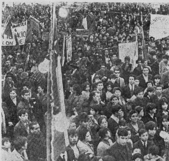
MASAS PROLETARIAS: ¿insurrección armada o lucha sindical?

Frente a todas estas críticas acerca de un modesto ejemplo de la línea de masas, me surge una duda ¿no estará pensando mi crítico que la lucha por el pliego de peticiones, que la lucha económica no tiene ningún sentido para la revolución socialista que él propone? ¿Que luchar por el pliego es caer en