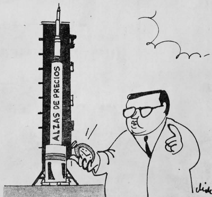
KRAUSS.— Nueve..., ocho..., siete...

como el mal uso de la "tremenda" inteligencia humana.