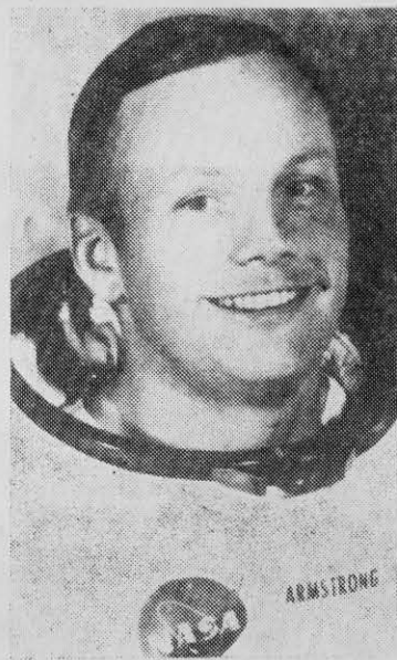
NEIL ARMSTRONG: lo espera una gerencia.

Porque en esta "Humanidad" tan manoseada de ahora hay por lo menos unos dos mil millones de terrestres que no se sienten implicados ni comprometidos por la experiencia norteamericana. No lo están los chinos ni los norvietnamitas, que luchan día a día contra el "pacifismo" de los Estados Unidos; como tampoco lo están la mayoría de los miembros de las comunidades de Latinoamérica, víctimas directas del imperialismo norteamericano; ni aun los líderes del movimiento negro estadounidense y menos los africanos y los asiáticos que luchan contra la dominación blanca en sus respectivos continentes. El concepto de "Humanidad", tan desenfadadamente utilizado en la placa que quedó en la Luna, ig-