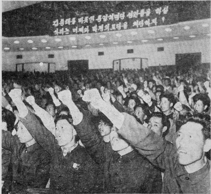
UN ASPECTO de un acto de masas celebrado en el centro industrial de Jamjeung (RPDC) para denunciar la represión terrorista en Corea del Sur.

El gobierno títere de Pak Jung Hi se negó a permitir siquiera el ingreso al país de una delegación de la OIP para hacer efectivo el premio. Mientras proseguían las ges-