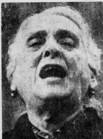
DOLORES IBARRURI: contra la intervención.

—Louis Aragón, laureado poeta comunista francés: “Es toda mi vida la que está en tela de juicio cuando reclamo para Checoslovaquia, en su valerosa lucha contra el