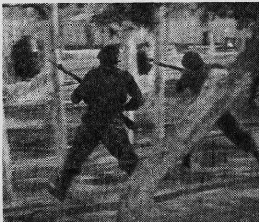
EJERCICIOS de comandos en la Escuela de Fuerzas Especiales y Paracaidistas del Ejército.

Los guerrilleros que murieron en el comba-