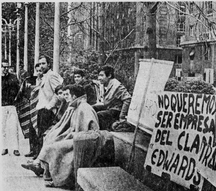
Universidades chilenas: sin la movilización combativa de la juventud, la reforma puede ser mediatizada por la reacción.

"Creo, de todos modos, que se avanzó bastante gracias a la movilización y a la lucha. Pero ahora se ha desmovilizado a la masa, se pretende una reforma pacífica y lenta,