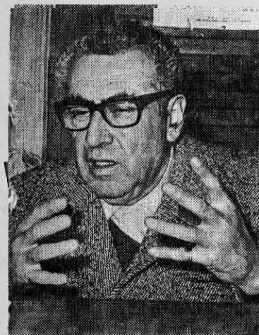
más afortunados incorporaron a su propia lira. Ha muerto un gran poeta y un hombre revolucionario. Pocos serán los que puedan caer con el corazón tan limpio como el suyo.

★ EL 10 DE SEPTIEMBRE, el gran poeta revolucionario Pablo de Rokha abatió con un balazo una larga vida formada de poesía e integridad humana. PF considera que el mejor homenaje que le puede rendir es publicar uno de sus poemas inéditos, que el extraordinario cantor nos entregara especialmente con ocasión de la entrevista con él sostenida poco tiempo antes de su muerte. El poema que publicamos, "Historia de Piojos", pertenece al libro inédito, fechado en 1968, Rugido en Latinoamérica, que PF pudo leer íntegramente. Pablo de Rokha que fuera calificado como "centro de tormenta de la poesía americana", en los tres cuartos de siglo de su vida combativa fue uno de los poetas que más odio despertara en los círculos reaccionarios, por la violencia revolucionaria de sus imágenes, y se vio obligado a editar y vender él mismo sus libros a lo largo de todo Chile y América Latina. Creador del "barroco popular americano", el gran poeta aportó hallazgos temáticos y expresivos que luego otros vates