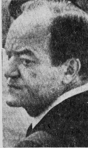
H.H.H.: ex cazador de brujas.

En el caso de la píldora, estas razones no aparecen claramente si es que no se ubica su causa en el miedo a desautorizar a los papas anteriores y atemorizar a las almas simples. Para un católico está fuera de dudas que el papa goza de una asistencia especial del Espíritu Santo, pero el Espíritu no es herencia particular de nadie; ilumina también las mentes de los obispos, los curas y los laicos. Los católicos del siglo veinte tienen bastante discernimiento para escandalizarse cuando la jerarquía de la Iglesia tolera, incluso para sus sacerdotes, el servicio militar y el uso de armas asesinas (a despecho del "no matarás") y se muestra tan