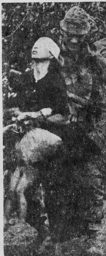
GUERRA DE VIETNAM: científicos universitarios enseñan a matar.

La Sociedad de Estudiantes Democráticos de Princeton (SDS) denunció que la División de Investigaciones sobre Comunicaciones está llevando a cabo un programa altamente calificado sobre criptografía para la Agencia Nacional de Seguridad. El cen-