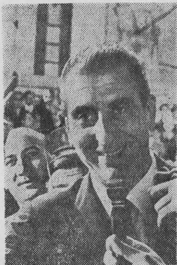
PRESIDENTE FREI: se acerca a los "gorilas" del continente.

¿Qué valor pueden tener esas frases en circunstancias que la dictadura brasileña fue una de las que envió tropas a República Dominicana para colaborar en la operosa ocupación yanqui de 1965? ¿Cómo se pueden interpretar esas afirmaciones cuando ambos regímenes participan activamente en el bloqueo a Cuba, la más inmoral de las acciones ordenadas por Estados Unidos?