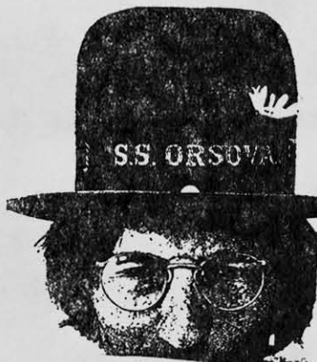
El "hippie" (fenómeno norteamericano).

EL publicitado film de Alvaro Covacevich, recaído como en su anterior peripecia de director, por una aligera obsesión hacia las flores municipales, pateadas ayer ellas como la supuesta expresión de rebeldía del personaje suyo de "Morir un poco", ofrece hoy el envés de la metáfora facilonga mediante una propuesta al espectador en arrebolados colores, donde esta vez la enamorada adoración a las flores muchas del verano, reflejaría la misma rebelión de mazapán que soportáramos ayer como lacios sismógrafos en butacas de cuero. El caso es que la actual película del enfrentado director, mediante la juventud dorada de nuestra burguesía de veraneo en la ciudad-jardín, pretende estar