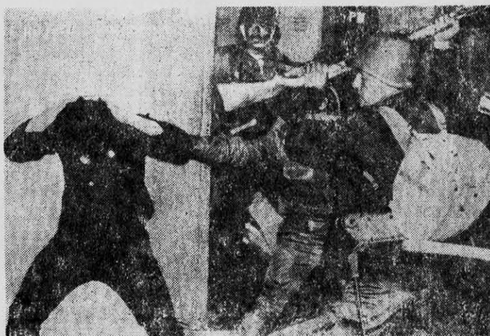
GRANADEROS —el cuerpo represivo mexicano— golpean con ferocidad a estudiantes de la capital de ese país.

2) Denuncia ante la Cámara de Diputados y de Senadores de los funcionarios públicos, responsables de la violencia desatada por el ejército y de la violación a la Constitu-