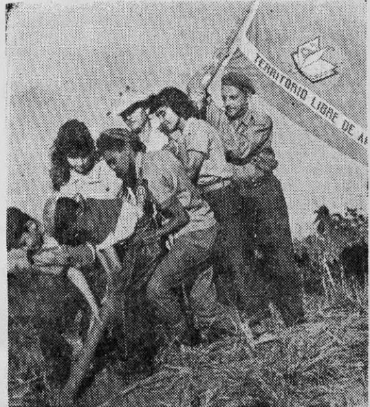
EN CUBA la clase obrera comprendió su papel revolucionario.

El sindicalismo es la filosofía de la acción y no de la discusión. El pueblo siente verdadera repugnancia por el mangoneo y quiere actuar responsablemente al margen de tuto-