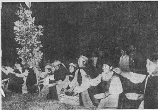
Araucanos en la ceremonia religiosa del canelo.

A despecho de esta situación, demostrativa de que el elemento indígena constituye base fundamental de nuestra población, el sello