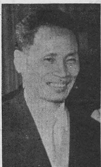
PHAM VAN DONG, premier norteamericano: un estratega brillante.

"Este ataque generalizado —agrega Pomonti— en la víspera de la campaña electoral norteamericana, obliga a la Casa Blanca a abandonar su actitud y a proponer a su vez (discurso de Johnson) el diálogo con Hanoi, ya que difícilmente la opinión pública de EE.UU. aceptará otra escalada militar. La tercera fase es, pues, la aceptación de Hanoi de las conversaciones preliminares, a pesar de la prosecución de los bombardeos sobre una parte de su territorio. Pero días antes de que la decisión de