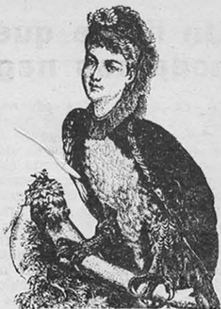
Bruno Schulz: un mundo alucinado.