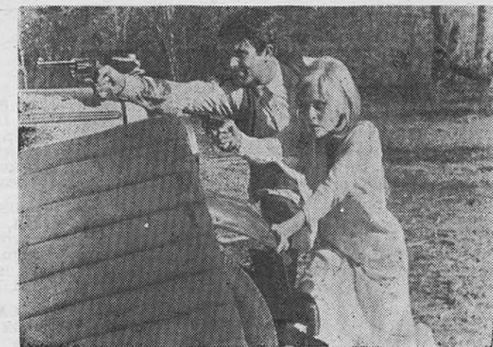
"Bonnie and Clyde": una ficción igual a la realidad.

Esas personas incapaces de conmoverse ante la injusticia, indiferentes al sufrimiento y dolor humanos, impasibles y egoístas frente al abuso y la explotación y que gozan con las orgías de sangre de los gangsters, son seres enajenados por la propaganda que distribuye la clase dominante. En todos los medios de comunicación, cine, radio, prensa y televisión, se dicta cátedra sobre el crimen, se divulgan todas las formas del delito y se atosiga al público con la imagen de un poder político y militar invencible, capaz de aniquilar a los que no sirven sumisamente los intereses de los Estados Unidos —que no siempre son los del pueblo norteamericano—, en cualquier lugar del mundo.