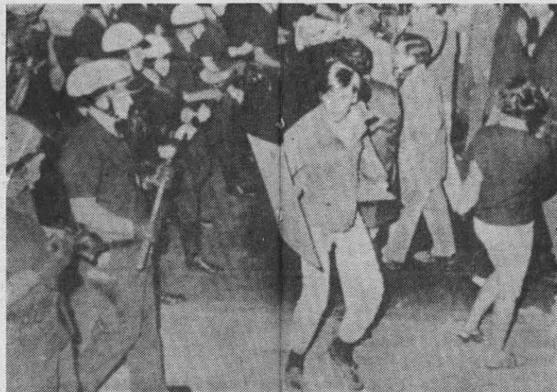
Columbia: el enfrentamiento estudiantil con la policía marca un paso en la lucha revolucionaria norteamericana.