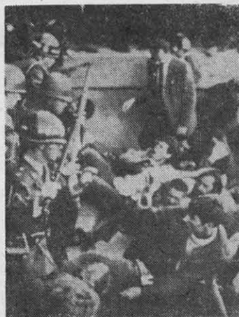
La violencia está también en la policía.