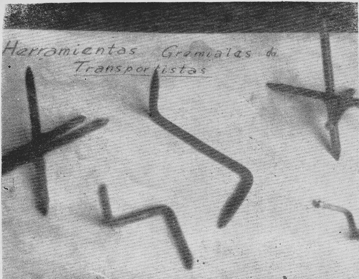
ESTOS SON los famosos "miguelitos" usados por los fascistas para pinchar las ruedas de los vehículos en los caminos del país y paralizar así el transporte carretero.

ran contra un camión conducido por Rafael Rodríguez.