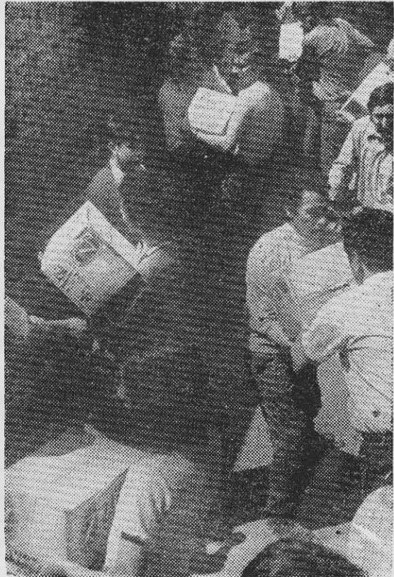
Estudiantes y los llamados "voluntarios de la patria", distribuyen alimentos.