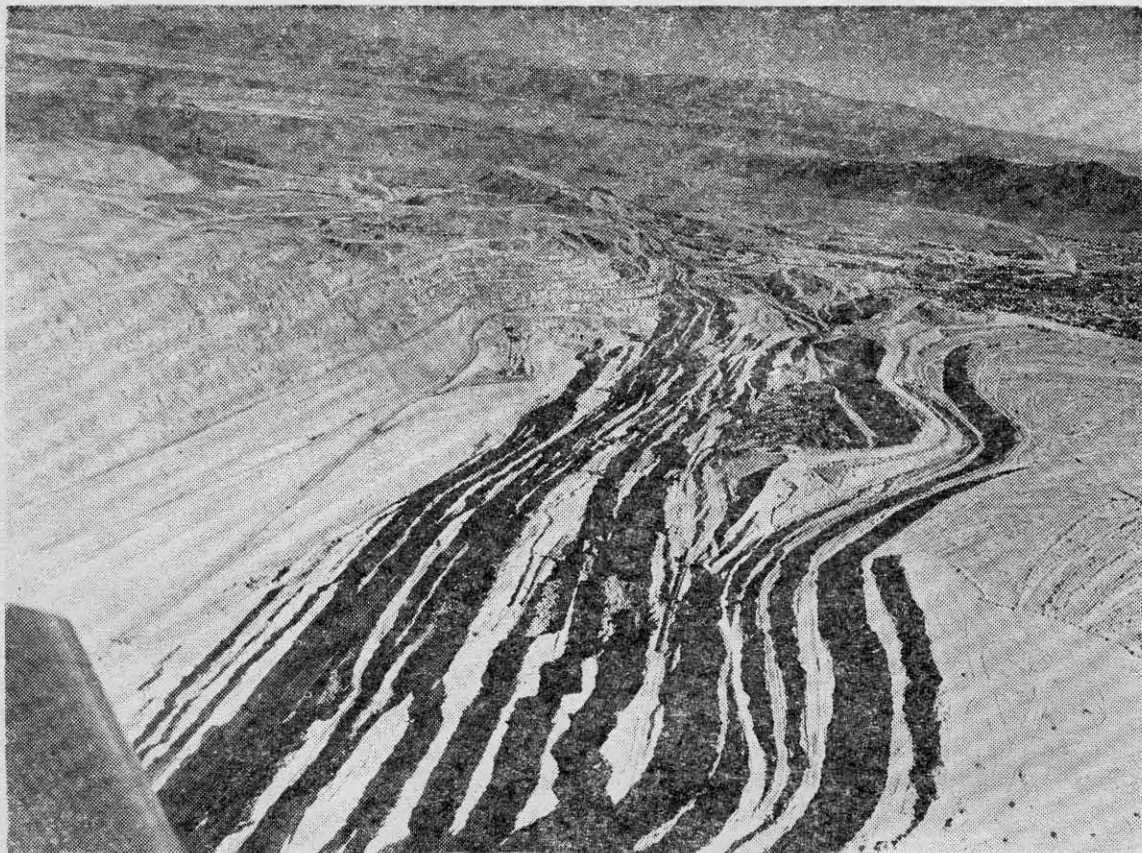
CHUQUICAMATA: la mina a "tajo abierto" más grande del mundo. Pertenece a Chile.