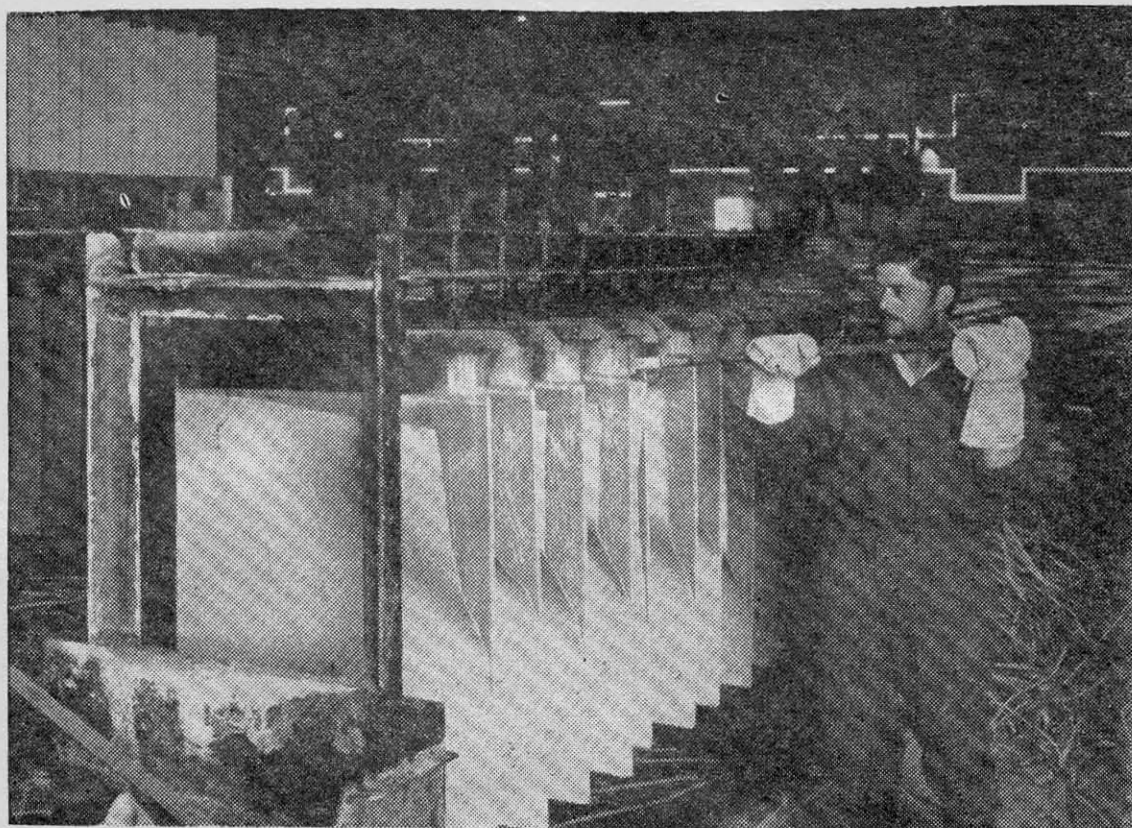
LA FUNDICION de cobre de Caletones, en el mineral de El Teniente.

mo legítimo, ya que corresponde al movimiento estricto de capitales.