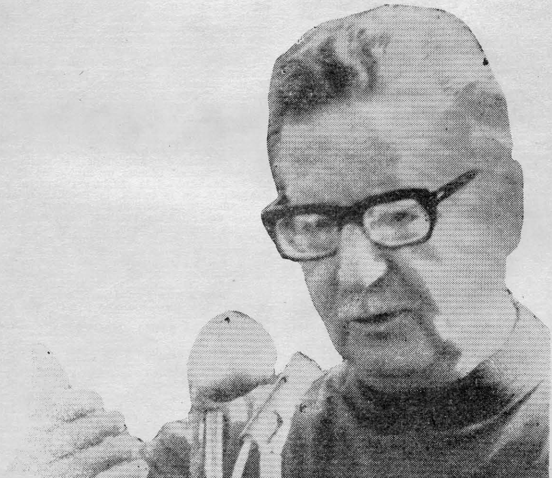
PRESIDENTE ALLENDE: el país entero exige que no se pague un centavo a las compañías yanquis.