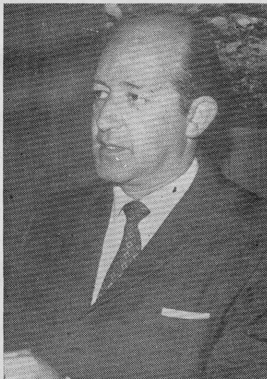
ORLANDO CANTUARIAS, Ministro de Minería.

12) Que tanto en Chile como en el resto de América Latina los ingresos provenientes de aportes de capital foráneo son muy inferiores a los egresos correspondientes a utilidades de inversiones ya efectuadas. La inversión extranjera no ha sido hasta ahora, por falta de regulación adecuada, un mecanismo en virtud del cual los países ri-