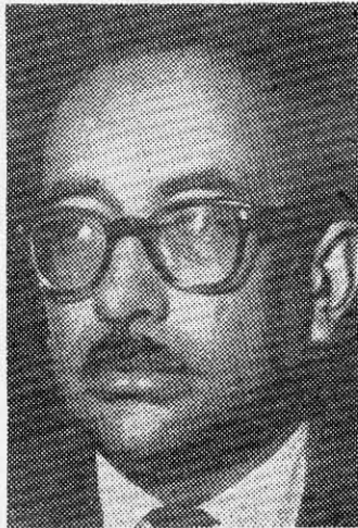
CANCILLER ALMEYDA: habló en la Plaza de la Revolución de La Habana.

"Yo traigo esta tarde a esta combativa e impresionante manifestación del pueblo de La Habana, al conmemorar un nuevo aniversario de la fecha heroica del Moncada, el saludo fraterno, solidario y revolucionario del pueblo de Chile, del Gobierno de la Unidad Popular y del Pre-